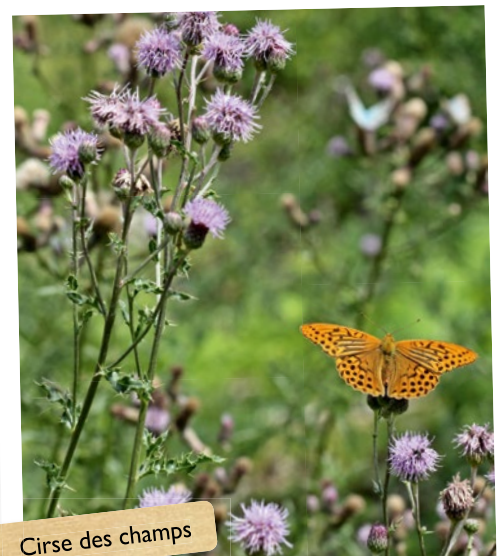
Cirse des champs

Elles viennent d'elles-mêmes, en général avec toute la famille, s'installent où ça leur plaît et se propagent. Ce ne serait pas grave si elle ne détruisaient voire ne chassaient pas les plantes destinées à ces emplacements. Certaines se reproduisent toujours elles-mêmes, d'autres, les pires, se propagent systématiquement sur des racines vastes et robustes. D'autres encore, les pires, adoptent deux stratégies. Les orties, la cirse des champs ou l'églantine en font partie.